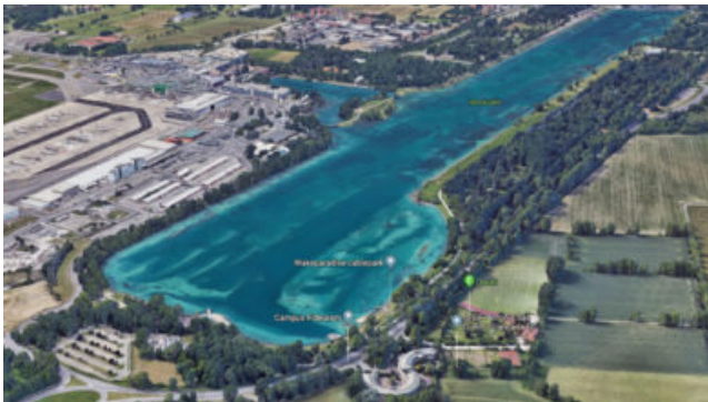
Idroscalo di Milano