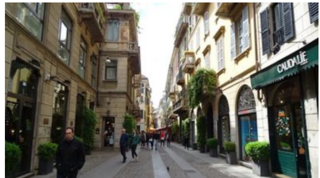
Via Brera a Milano