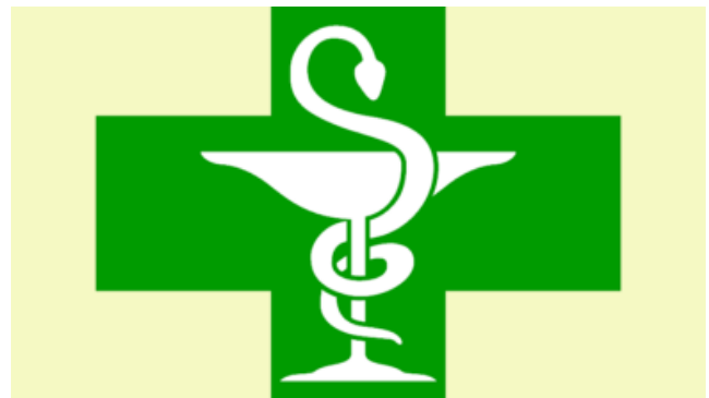
Pharmacies in Osio Sotto