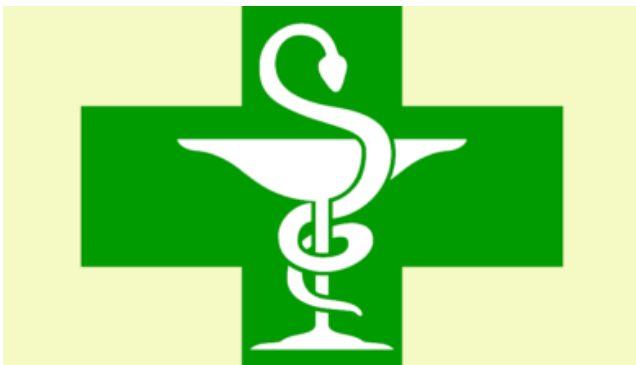
Caprino Bergamasco Pharmacies