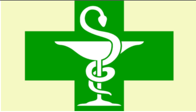
Pharmacies Villa d'Almè

ARRIVA IL 1° PADEL EXPO, A MILANO LAVVENIMENTO INTERNAZIONALE