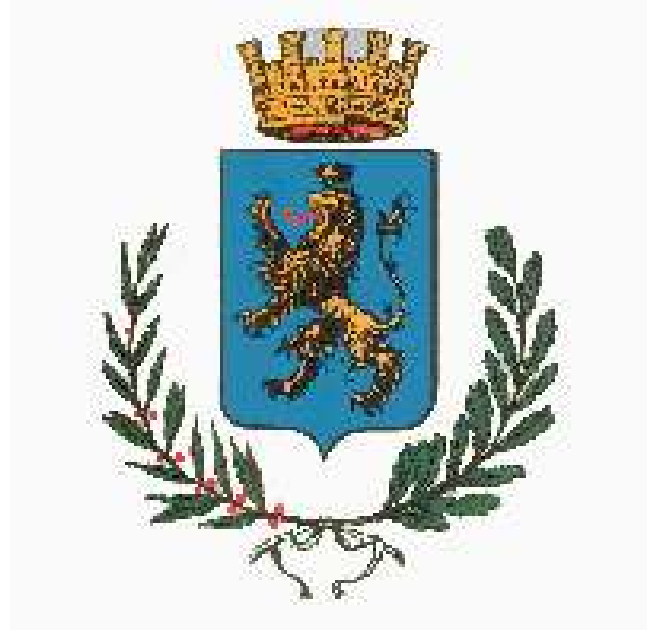
Comune di Abbiategrasso (MI)